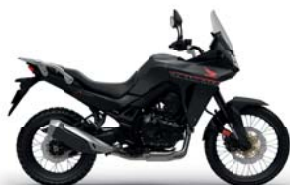
Mat Ballistic Black Metallic